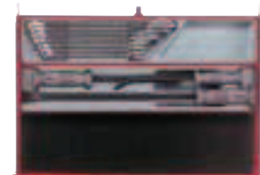
Contiene: TTXPB3A - TTX2032

Antes: 4.890€ Dto: 40% 2.934€ TCMMAUTO1 144350105